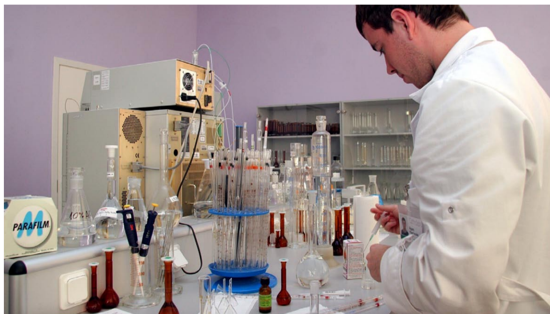
«Grindeks» 2006. gadā, ņemot vērā augsto inflāciju, darbiniekiem algas paaugstināja par 30%.

- Šobrīd arodbiedrībā ir aptuveni puse no 600 «Grindeks» darbiniekiem, kā arī pensionāri. Mēs nemitīgi skaidrojam, lai piesaistītu jaunus cilvēkus. Šogad no mūsu arodbiedrības kopumā būs aizgājuši kādi 15 cilvēki, bet vairāk nekā 20 būs iestājušies no jauna. Lai arī cik dāvaini tas šķīstu, daļai cilvēku iemesls aiziešanai no arodbiedrības ir algas paaugstinājums, jo līdz ar to aug arī biedra nauda!