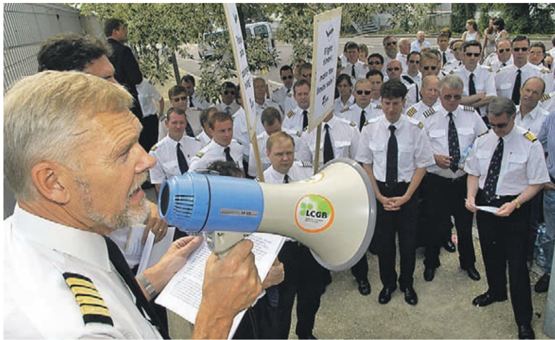
Eiropas aviācijas nozares darbinieku pārstāvji manifestācijā Luksemburgā izvirza prasības par darba un atpūtas laika sabalansēšanu.