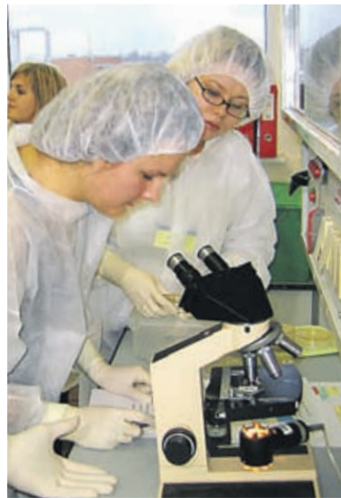
Latvijas Universitātes studenti darba procesā «Grindeks» laboratorijā.