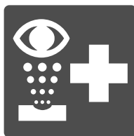
8.4. Acu skalošana

Piemēram, "Pirmās palīdzības punkts" vai arī: