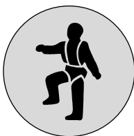
6.9. Jālieto aizsargjosta

Pirmās palīdzības un glābšanas papildzīmes norādes zīmes – zīmes, kas sniedz informāciju par pirmās palīdzības sniegšanas vietām, sanitāro inventāru, kā arī papildu maršrutiem un evakuācijas izejām.