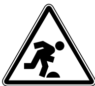
4.21. Uzmanību, pakāpiens

Rīkojuma zīmes – zīmes, kas norāda uz konkrētu darbību, piemēram, "Jālieto aizsargbrilles!", "Ceļš gājējiem" utt.