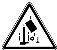
4.25. Uzmanību, krītoši objekti

Brīdinājuma zīme ir trīsstūra formā ar melnu piktogrammu uz dzeltena fona, apmales – melnas. Piemēram: